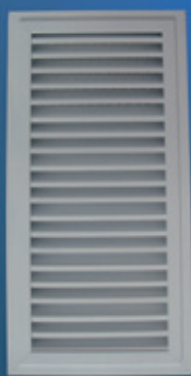
S 352 - WK2